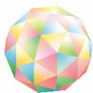
日本リスキリングコンソーシアム 学び続けよう、未来のために。

ヒューマングループは、教育事業を中核に、人材、介護、保育、美容、スポーツ、IT と多岐にわたる事業を展開しています。1985年の創業以来「為世為人（いせいいじん）」を経営理念に掲げ、各事業の強みを生かし、連携しながらシナジーを最大限に発揮する独自のビジネスモデルにより、国内330拠点以上、海外5カ国6法人のネットワークでお客様に質の高いサービスを提供しています。